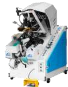
Gambar 6. Mesin toe lasting

Mesin lasting digunakan untuk menggabungkan upper diatas acuan, kemudian menarik kebawah lasting allowances sehingga upper melekat pada texon , sehingga menjadi bentuk sepatu setengah jadi.