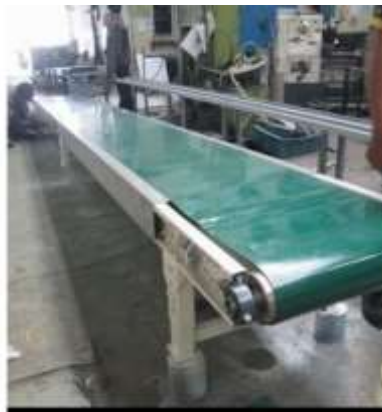
Gambar 3. Mesin conveyor

Conveyor, atau mesin konveyor, adalah alat yang digunakan untuk memindahkan barang dari satu tempat ke tempat lain. Alat ini dapat menangani berbagai kapasitas, dari kecil hingga besar, dan berfungsi sebagai sistem angkut yang efisien. Dalam industri, conveyor sangat berguna untuk mengangkut bahan-bahan yang berat, berbahaya, atau sulit diangkat oleh manusia, serta menyediakan solusi transportasi yang cepat dan efisien[4]. Untuk mengatasi keterbatasan tenaga manusia dan memastikan keselamatan serta keamanan pekerja industri, diperlukan alat bantu angkut. Mesin konveyor sering dipilih sebagai solusi untuk mengangkut bahan-bahan industri yang padat, karena efektif dalam mengatasi kebutuhan angkutan dalam proses produksi..