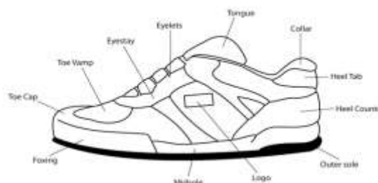
Gambar 1. Bagian – bagian sepatu