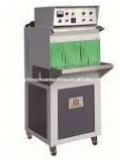
Gambar 5. Mesin steam (pemanas)

Steam merupakan mesin uap panas bertekanan tinggi yang dihasilkan oleh air sampai titik didih tertentu sehingga menghasilkan uap panas. Mesin ini digunakan sebagai mesin pendukung memanaskan agar tetap dalam keadaan hangat/panas sehingga ketika upper dipasangkan ke acuan, upper tersebut mengikuti bentuk acuan.