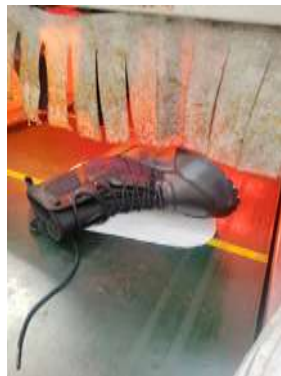
Gambar 7. Gambar upper & oven

Gambar upper yang setengah jadi setelah proses jahit (sewing) yang kemudian masuk di proses assembling. Upper tersebut dilem terlebih dahulu, setelahnya masuk ke dalam oven (pemanas) untuk mengeringkan lem dan melemaskan upper.