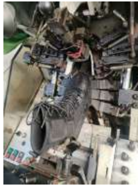
Gambar 9. Gambar upper & toe last

Upper yang sudah di steam tadi langsung masuk proses toe last . Proses toe last sendiri yaitu mengapit bagian bawah dengan menjepit terus ditarik oleh capit, kemudian pisau toe last turun untuk menyatukan bagian upper ke tekson dibagian bawah.