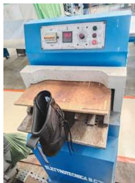
Gambar 8. Gambar upper & steam

Gambar upper yang setengah jadi setelah proses jahit (sewing) yang kemudian masuk di proses assembling. Upper tersebut dilem terlebih dahulu, setelahnya masuk ke dalam oven (pemanas) untuk mengeringkan lem dan melemaskan upper.