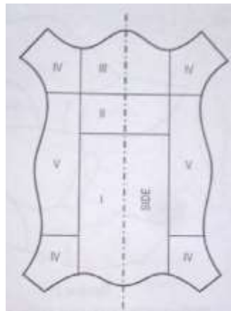
Gambar 2. Bagian-bagian kulit

Kulit merupakan salah satu material tekstil yang digunakan untuk menghasilkan produk kerajinan. Dalam industri tekstil, bahan baku kulit dibagi menjadi dua, yaitu kulit asli ( genuine leather ) dan kulit sintetis. Keduanya memiliki perbedaan karakteristik[5].