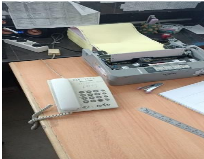
Gambar 4. Ketersediaan Telepon di Ruangan

Sebagian informan menyebutkan bahwa telepon masih ada dan sangat bermanfaat untuk koordinasi, sedangkan satu informan lainnya mengungkapkan bahwa telepon sudah tidak tersedia dan perlu disediakan kembali. Telepon sangat membantu dalam menghubungi bagian lain atau saat dokumen tidak ditemukan, tetapi tidak meminimalisir keterlambatan pengembalian rekam medis, karena hanya berfungsi sebagai alat koordinasi dan komunikasi. Keberadaan telepon juga dapat dibuktikan berdasarkan hasil dokumentasi sebagai berikut.