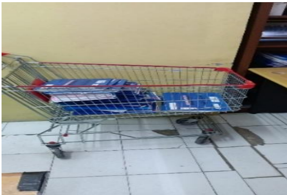
Gambar 1. Ketersediaan Troli

Troli terbukti sangat bermanfaat dalam mempermudah pengangkutan dokumen dalam jumlah banyak, mengurangi beban kerja admin, dan menghindari bolak-balik yang melelahkan.