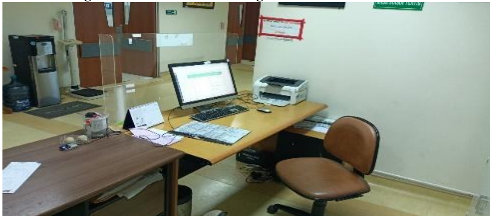
Gambar 3. Ketersediaan Komputer di Ruangan

Informan menyatakan bahwa komputer sudah ada dan mempermudah pekerjaan dengan memungkinkan pengecekan riwayat kunjungan dan pencetakan label barcode. Semua ruangan telah dilengkapi dengan komputer yang mendukung proses administrasi. Hal tersebut didukung oleh dokumentasi sebagai berikut.