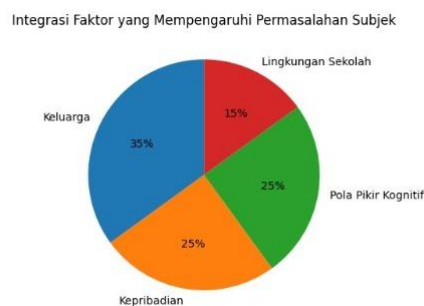
Gambar 2. Diagram Faktor yang Mempengaruhi Permasalahan Subjek

Selain itu, integrasi hasil asesmen secara menyeluruh ditampilkan pada Gambar 2, yang menunjukkan bahwa permasalahan subjek dipengaruhi oleh beberapa faktor utama, yaitu faktor keluarga (35%), kepribadian (25%), pola pikir kognitif (25%), dan lingkungan sekolah (15%). Persentase ditentukan berdasarkan integrasi hasil wawancara klinis, observasi, dan asesmen psikologis secara profesional. Dominannya faktor keluarga menunjukkan bahwa dinamika relasional berperan penting dalam pembentukan dan pemeliharaan distorsi kognitif subjek. Namun demikian, kontribusi pola pikir kognitif yang cukup besar memperkuat rasional pemilihan CBT sebagai pendekatan intervensi utama, karena faktor ini bersifat langsung dapat dimodifikasi melalui proses restrukturisasi kognitif.